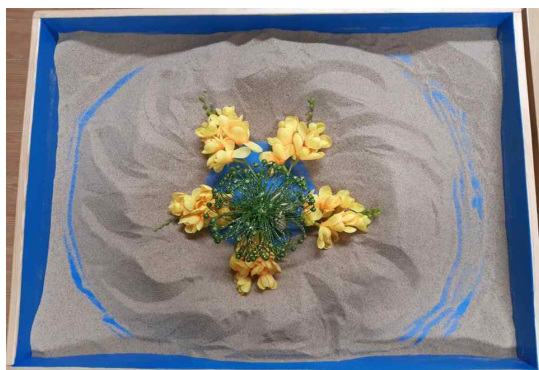
그림 5. 작품 5(session 10)

작품 3, 4, 5는 순례의 순환 구조를 보여 준다. 작품 3은 상담 5회이고, 작품 4는 6회, 작품 5는 10회이다. 작품 3은 사막에 강이 생겨난 기적을 표현하였는데 내담자는