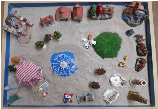
그림 4. 작품 4(session 6)