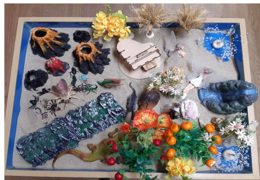
Figure 2. Work 2 (session 4)

In the third episode, the client expressed her trip to the desert, a remote and unfamiliar land. The unfamiliar desert symbolically expresses a scene separated from everyday life. She is still with her older sister in the real world who relies on her like a mother (her biological mother is dead), but the tourist on the left is a stranger, and the encounter with a stranger in a strange desert suggests a new event.