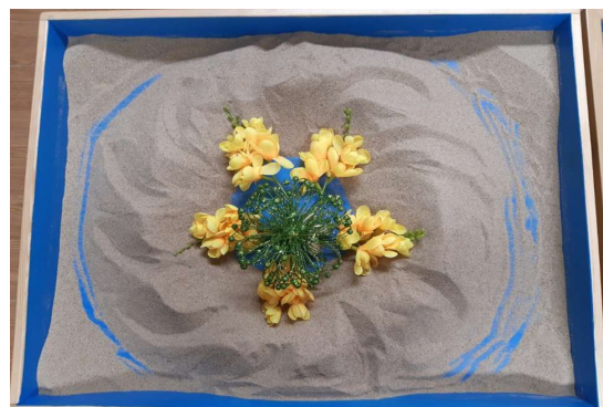
Figure 5. Work 5 (session 10)

Works 3, 4, and 5 show the circular structure of pilgrimage. Work 3 is 5 session, work 4 is 6 session, and work 5 is 10 session. Works 3 expressed the miracle of the creation of a river in the desert, and the client explained this work in Isaiah 43:18 of the Bible. 'Don't