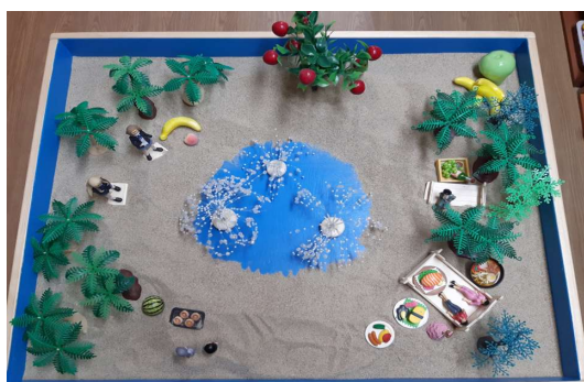
Figure 1. Work 1 (session 3)

The purpose of this study is the theme of pilgrimage that appeared in the process of sandplay therapy. Therefore, the client's psychological evaluation, major symptoms, and treatment progress were omitted, and this study presents a series of works symbolically expressing the subject of separation, conversion, and integration, which are the structures of pilgrimage in the sandplay treatment process.