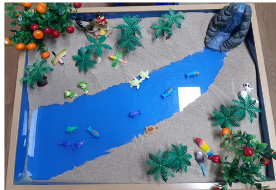
Figure 3. Work 3 (session 5)

Deep and dark places like caves, underworlds, and underground in the castle are good places for conversion to take place. Stranger things are far away like tourists and strangers in Works 1, but they are also unfamiliar things in 'me' like the title of the work written by the client, "Cave in My Heart." Reptiles such as snakes, dinosaurs, and crocodiles, and insects such as larvae and butterflies, are good objects to represent transformations symbolically. Born from an egg and a butterfly's one-year-old, which is transformed into an egg, caterpillar, pupa, or adult, allows the client to symbolically face the dark parts of her mind and unconscious elements, such as the negative, the lacking, the gross, and the immature. Metaphorical and implicit symbolic experiences are ambiguous compared to linguistic confrontations, but they are accompanied by safe and strong emotional experiences. In Teresa's inner castle of Avila, the human soul meets a snake, becomes a butterfly, and begins a symbolic experience of pilgrimage in the sandbox, just as she married a king in the castle.