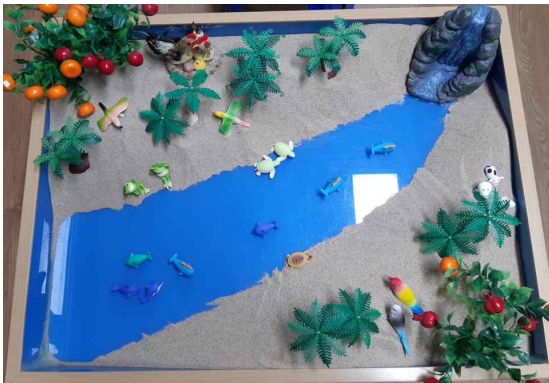
그림 3. 작품 3(session 5)

성에서 왕과 결혼한 것처럼 내담자는 모래상자에서 순례의 상징적 체험을 시작하고 있다.