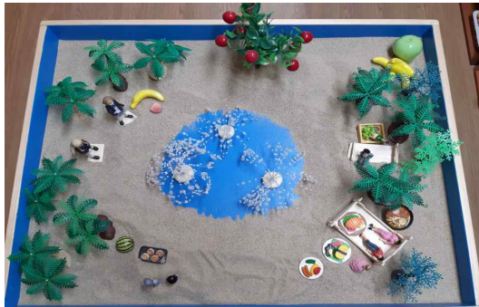
그림 1. 작품 1(session 3)

본 연구의 목적은 모래놀이치료 과정에서 나타난 순례의 테마이다. 따라서 내담자의 심리평가와 주요 증상 및 치료 경과 등은 생략하였고, 내담자가 모래놀이치료과정에서 순례의 구조인 분리, 변환, 통합의 주제를 상징적으로 표현한 작품을 시리즈로 제시하고자 한다.