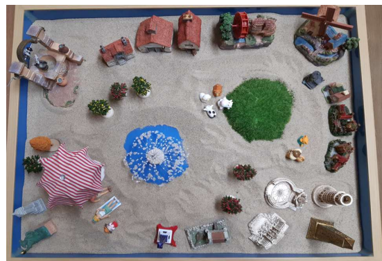
Figure 4. Work 4 (session 6)