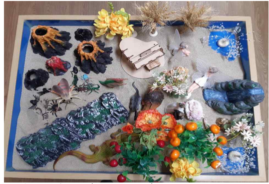
그림 2. 작품 2(session 4)

내담자는 3회기에 먼 곳 낯선 땅인 사막으로 여행을 표현하였다. 낯선 사막은 일상 생활로부터 분리된 장면을 상징적으로 표현하고 있다. 아직 엄마처럼 의지하는(친모는 사망) 현실세계의 큰언니와 함께하고 있지만, 좌측의 관광객은 이방인으로 낯선 사막에서 낯선 사람과의 조우는 새로운 사건을 암시하고 있다.