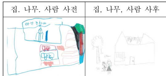
그림 9. 사전-사후 그림 검사

회기가 진행될수록 내담자가 모래상자에서 아빠와 자신의 연결고리를 찾으려는 절박함과 떠난 아빠가 주지 못한 부성을 스스로 찾아 화해하고 안착하고자 하는 무의식적 내용들이 모래상자에 원형으로 나타나고 있었다.