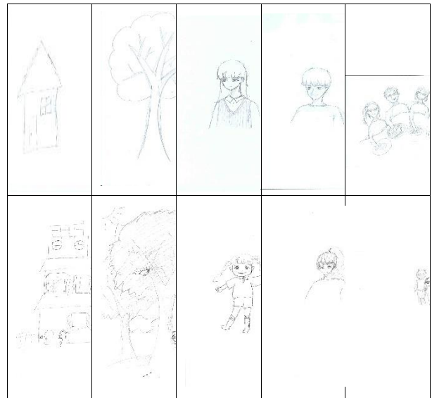
그림 1. 사전, 사후 그림검사(HTP, KFD)

그러나 30회기의 Sand-play Therapy 여정을 지나면서 자존감이 회복되고, 자신감을 갖고 또래 및 관계 맺기를 하며 감정을 언어로 표현하면서 자신이 갖고 있는 능력을 발휘해 나가는 모습을 볼 수 있었다. 이러한 내담자의 성장은 사후에 실시된 그림검사를 통해서도 느낄 수 있었다.